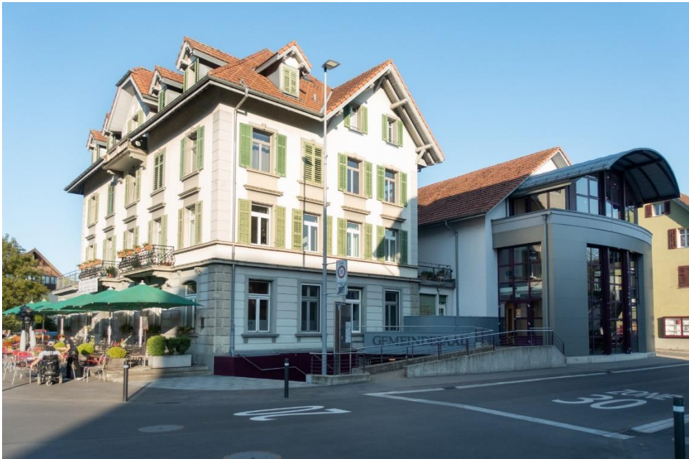
Restaurant Bahnhof mit Eingang zum Gemeindesaal Malters (rechts)

Im Eingangsbereich steht genügend Platz für den Betrieb einer Bar und eines Foyers zur Verfügung. Dort können vor und nach den Vorstellungen anregende Gespräche und der Austausch mit unseren Besuchern in gemütlicher Atmosphäre stattfinden.