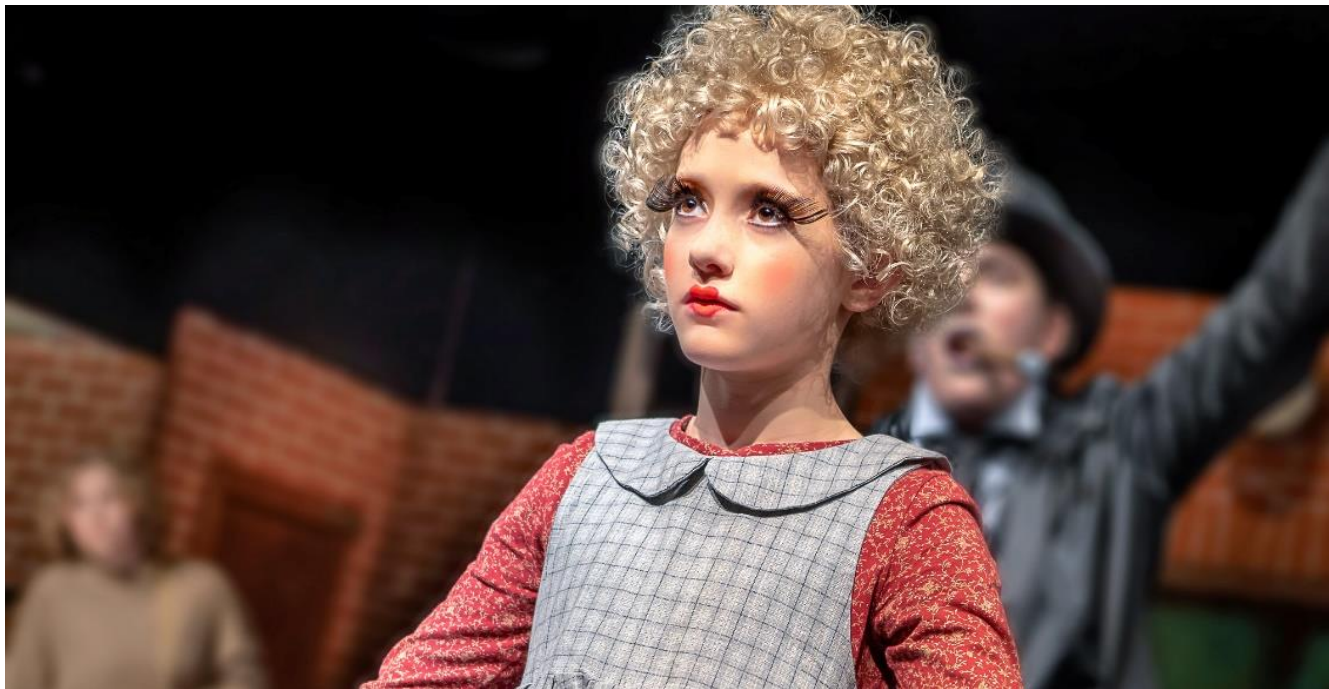
Impressionen aus «Momo» (2018)

Erfahren Sie in dieser Projektdokumentation allerlei Wissenswertes über das aktuelle Theaterprojekt und das Vollgastheater. Wir freuen uns über ihr Interesse.